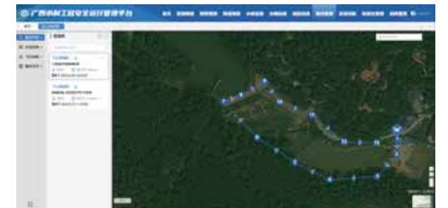
广西某市县安全监测设备及新技术应用