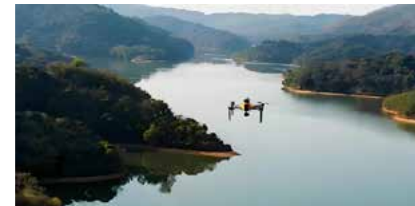
富春江无人值守智能巡库