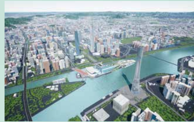
三维空间底座构建

方案囊括三维空间底座构建，为精确航线规划、三维空域管控等业务的实施提供数据基础。根据项目实际需求，以固定式、移动式等方式，进行机场建设，实现周期性巡检、兴趣点检测。方案也包括低空管控与信息服务平台建设，可实现业务流转、任务编排、飞行管控、数据管理等全流程功能需求。同时，南方测绘提供专业的无人机驾驶培训，一个月内即可持证作业。