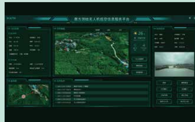
低空管控与信息服务平台建设