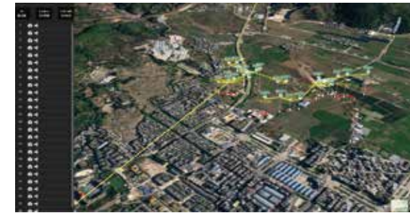
智能化飞行规划与管控