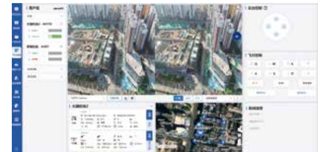
云南省自然资源调查监测低空服务平台