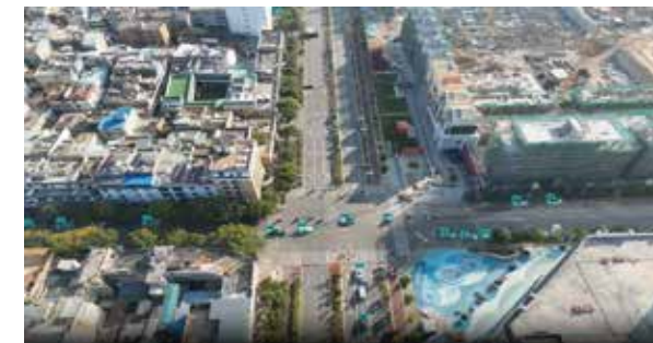
快速适应多行业需求