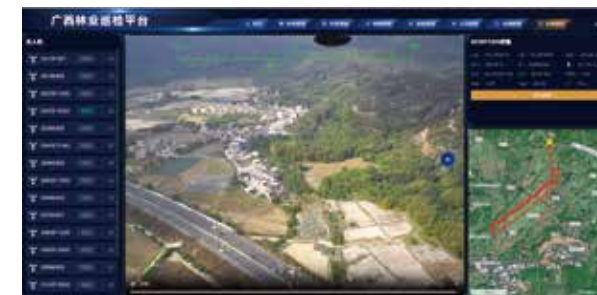
广西航空护林项目